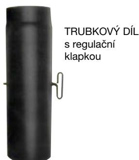
TRUBKOVÝ DÍL s regulační klapkou