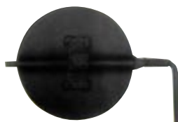
REGULAČNÍ KLAPKA volná